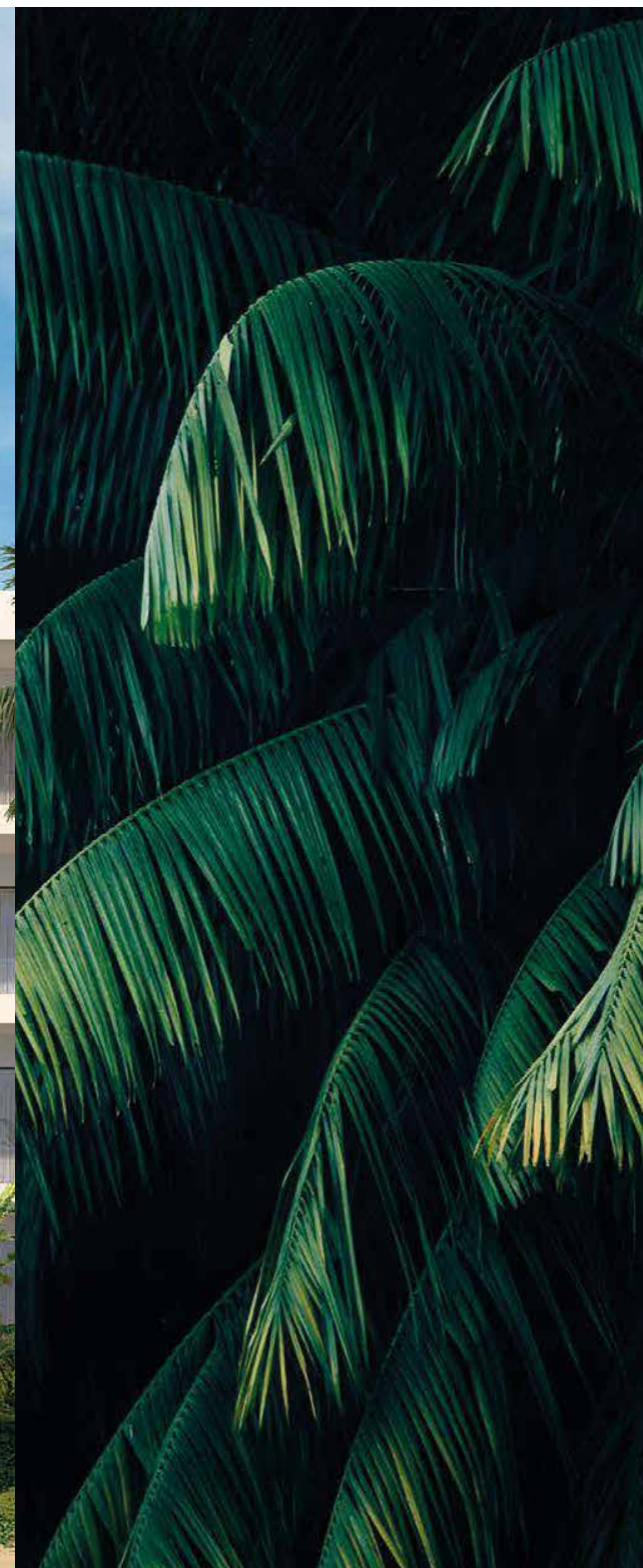
FACHADA POSTERIOR ▶