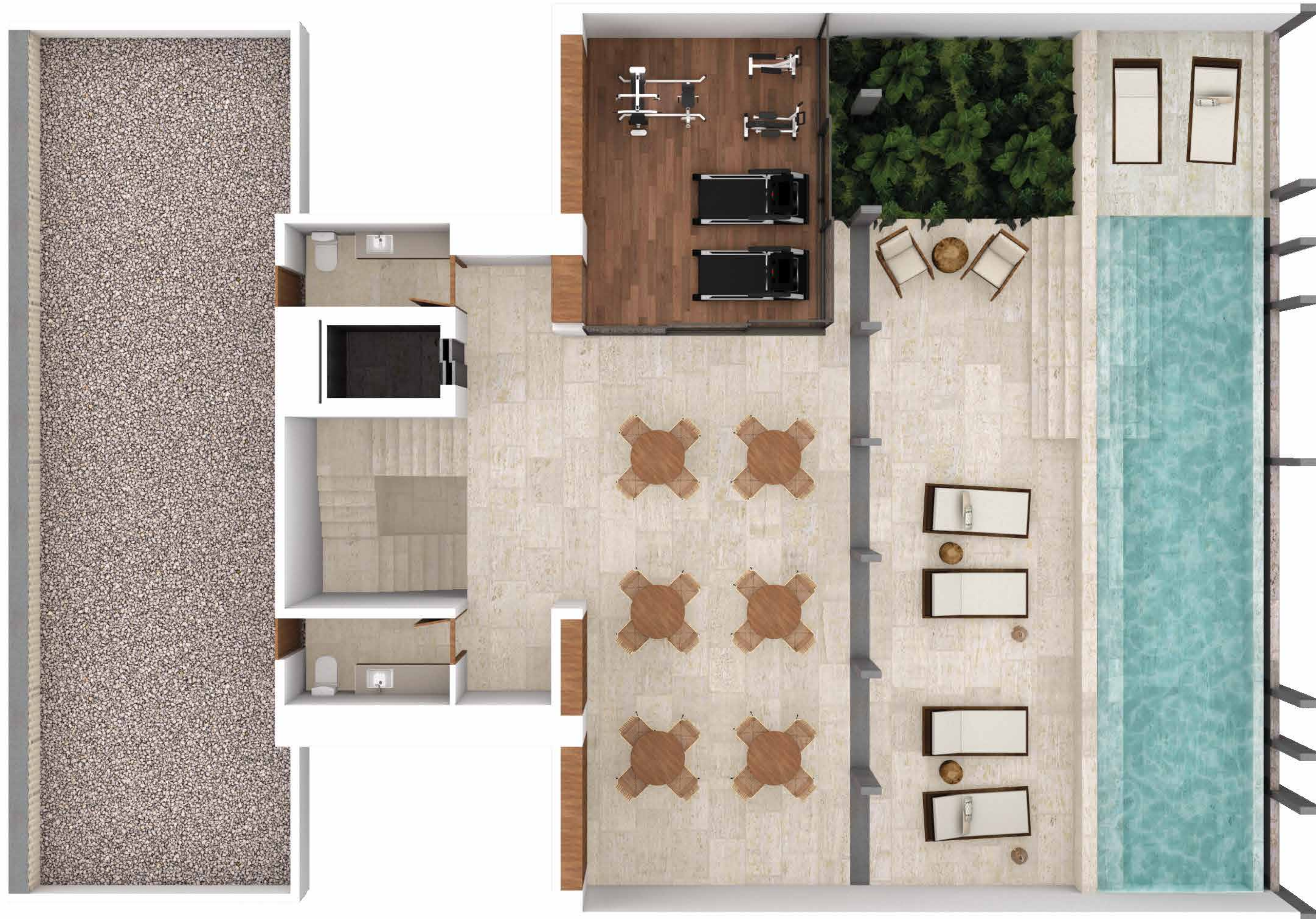
PLANTA DE AMENIDADES EN ROOF GARDEN